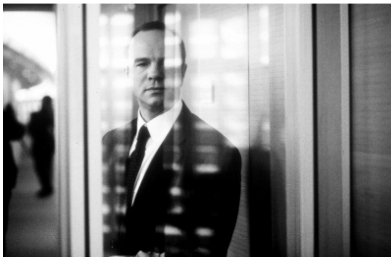
L. Cantet, L'emploi du temps , 2001.

L'Emploi du temps , de Laurent Cantet (2001)