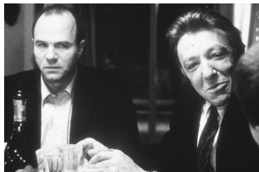
L. Cantet, L'emploi du temps , 2001.

toujours sur le parking, l'aborde en frappant à sa vitre pour manifester le désir de le voir. À chaque fois ce qui arrive tombe du ciel ; et à nouveau, Vincent se présente comme un grand enfant, ou un de ces sauvages de bande dessinée qui pensent que la trame du temps est faite d'événements sans lien, de survenues sans causes. Vincent est de ces croyants qui savent, d'une indéfectible foi, qu'un héros, le grand Autre diraient certains, viendra tout arranger. En ce sens, L'emploi du temps est un grand film sur la croyance.