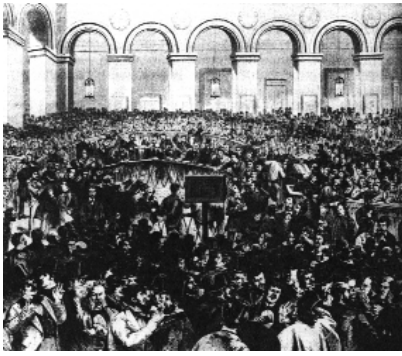
Dans la Grande salle de la Bourse. Dessin de Pelcoq.

Bourse de Ponsard en 1856 un moment où le jeune spéculateur malheureux s'écrie : « – Ah ! je suis perdu ! – Bourse infâme ! Antre ! Repaire ! / Coupe-gorge en plein jour ! Tripot ! – Maudit sois-tu, / Foyer des passions ! Tombeau de la vertu ! ». Ce discours d'exécration ne montre pas seulement à quoi ressemble une comédie de mœurs très applaudie à la Comédie Française au début du Second Empire ; il s'affiche aussi comme une fabrique de métaphores dont la prolifération même signale l'insuffisance. Ce n'est là qu'une manifestation de l'embarras de la littérature lorsqu'elle fait le procès de la spéculation, comme l'ambitionnent La Bourse de Ponsard et La Question d'argent (1857) de Dumas-fils. Ces deux sommets du théâtre boursier du siècle sont un double non-lieu. D'abord, on n'y voit pas la Bourse : il n'y a que le vaudeville pour affronter cette gageure en parodiant les cotations ( La Bourse au village , de Clairville, en 1856) ou en installant la corbeille en fond de scène ( Monsieur Gogo à la Bourse , de Bayard, en 1838) ; du reste, il y a là un jeu sur la cohue qui n'est peut-être qu'une autre forme de non-lieu. Ensuite, les pièces de Ponsard et Dumas-fils souffrent d'une propension à discourir qui les rend très statiques par rapport à une réussite comme Le Faiseur (1851) de Balzac, et l'expertise financière qu'appelle la volonté de juger leur fait évidemment défaut. L'arsenal rhétorique déployé par