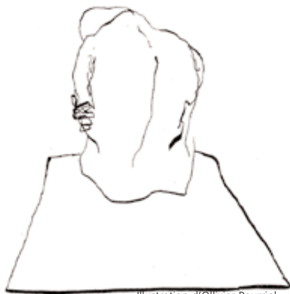
Illustration d'Olivier Pourriol