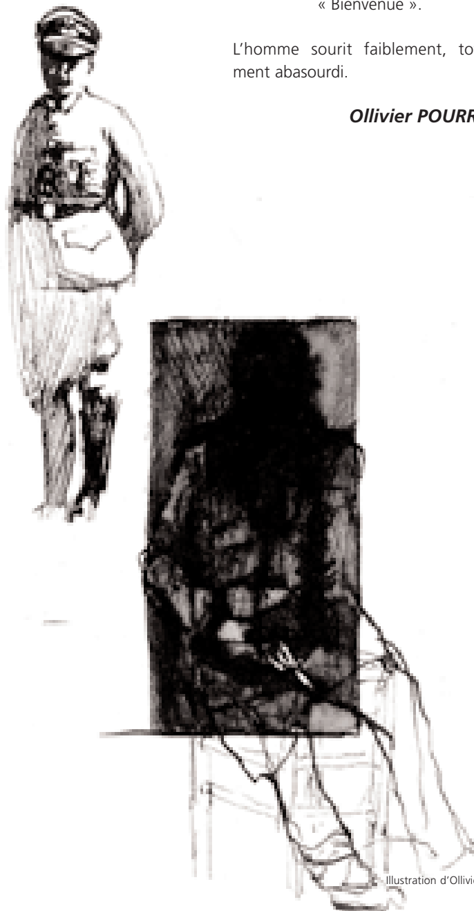
Illustration d'Olivier Pourriol