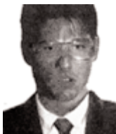
Image « officielle », dont (9) prend même soin de masquer les yeux... alors que :

j'ai appris d'où venait la photo que l'on voit partout (y compris chez moi) : c'est Tom Cruise avec des yeux différents ! (1)